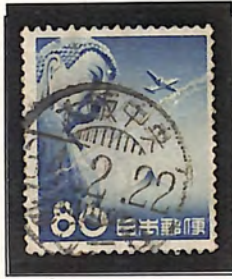
大阪中央 34. 2. 22