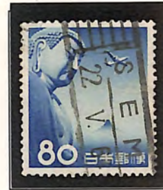
SEM- 22. V. 64