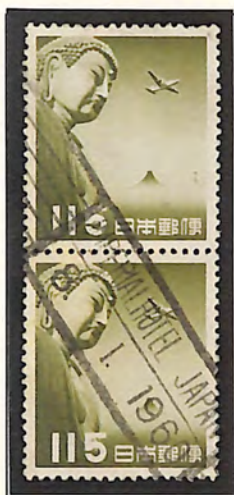
IMPERIAL HOTEL 8. 1. 1960