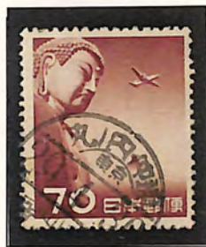
丸ノ内仲通/東京 29. 4. 30