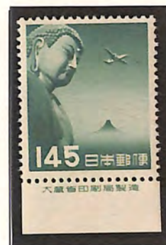
下抜・逆抜櫛型(穴あり)