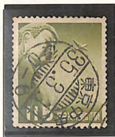
東京中央 35. 3. 14

北アフリカ(第4地帯)宛て航空便書状 10gまで 115円 (1958. 7. 1~1959. 3. 31) OSAKA XI. 58 20-22