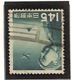
OSA- 9. - . - -