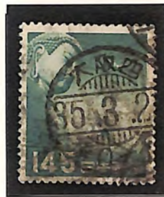
大阪西 35. 3. 2-