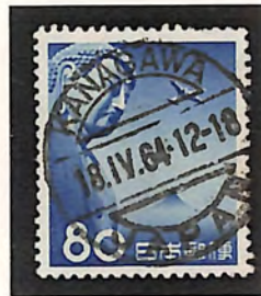
KANAGAWA 18. IV. 64