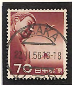
OSAKA 22.II.56 16-18