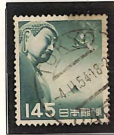
TOKYO 4. II. 54