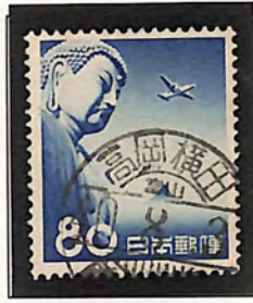
高岡横田・富山 40. 8. 3