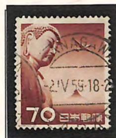
KANAGAWA 2. V. 59 18-24