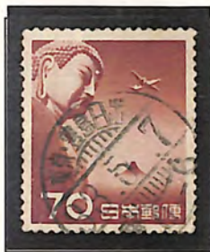
東京・豊島日出 33. 5. 7

スイス(第4地帯)宛て航空便印刷物 20gまで 70 円 東京~ジェバ~チューリヒ便就航 FFC KYOTO AP 10. IV. 57