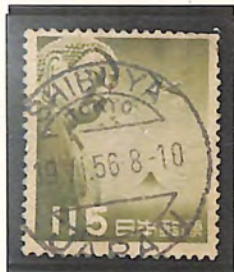
SHIBUYA/TOKYO 19. VI. 56