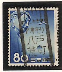
アオモリ八戸荒町