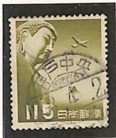
神戸中央/国際 ビル内 33. 4. 2-