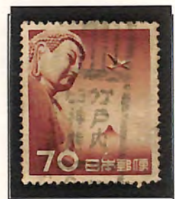
ヒョウゴ神戸熊内