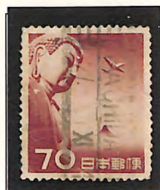
MACHIDA 27. XI. 1 -