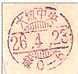
裏面着印 大阪 26.4.23 後0-6