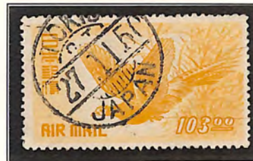
TOKYO/OT 17. 11. 50