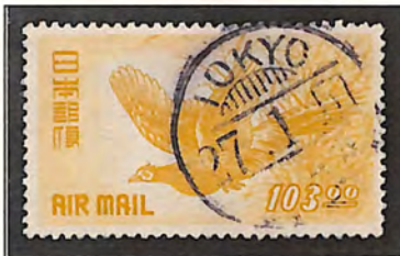
TOKYO 27. 1. 51