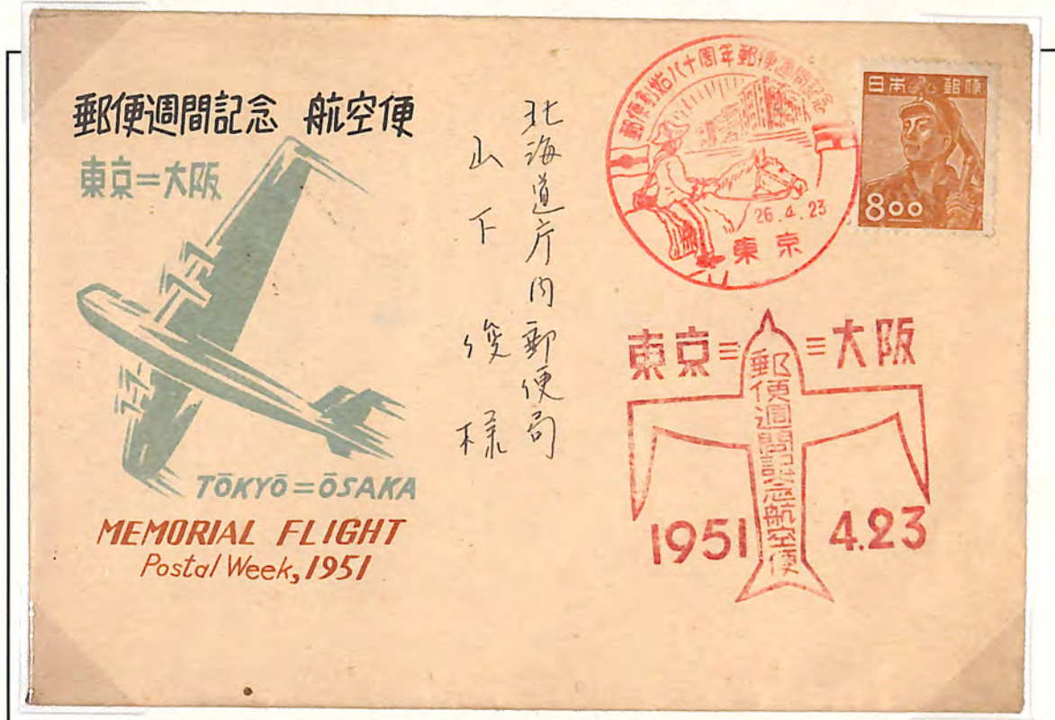
産業図案「炭鉱夫」8円貼 郵便創始80周年郵便週間記念特印 東京 26.4.23

1951年(昭和26)4月26日、郵便週間を記念する東京~大阪間の臨時航空便が一往復実施されました。期間内に手続きをすれば、通常料金(書状 8 円)で航空便で配達されました。当時はまだ連合国の占領下で、民間航空が認められていなかったため、米国民間社のDC4型キャスリー号で搬送しました。(笹尾 1998, p.157)