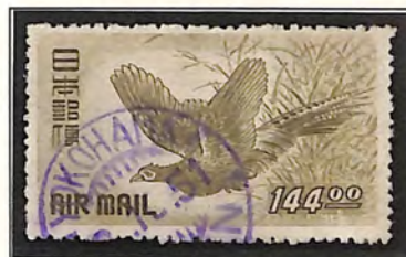
YOKOHAMA -1-. 51