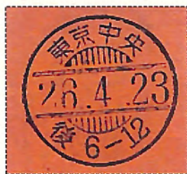
裏面着印 東京 26. 4. 23 後 6-12