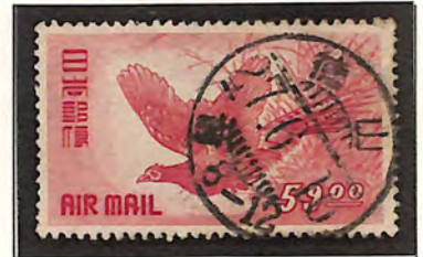
徳山 27. 6. 16