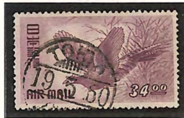
TOKYO 19. 5. 50