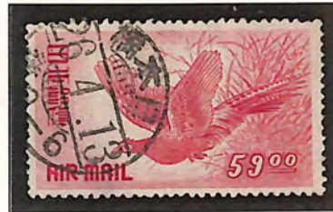
日本橋 26. 4. 13