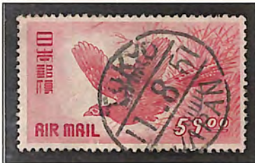
TOKYO 11. 8. 50