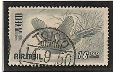
TOKYO 14. 9. 50