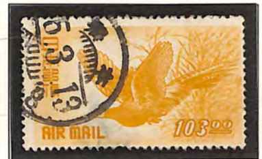
本郷 -5. 3. 13