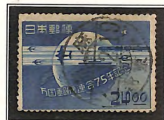
麻布 24. 12. 19 東京都